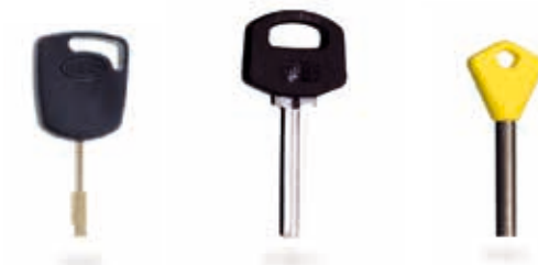
Ford e Jaguar Ford and Jaguar Ford und Jaguar Ford et Jaguar Ford y Jaguar

Falcon is the only mechanical key cutting machine for special keys that combines ease of use and strength, thanks to the design of its base and to the reliable accessories, that guarantee the perfect stability of the key during the cutting phase, thus guaranteeing a perfect execution.